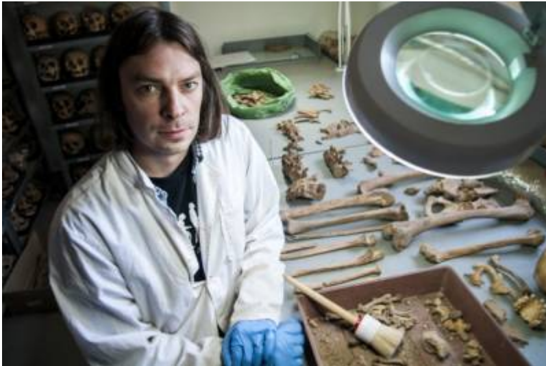
Ein Anthropologe an seinem Arbeitsplatz